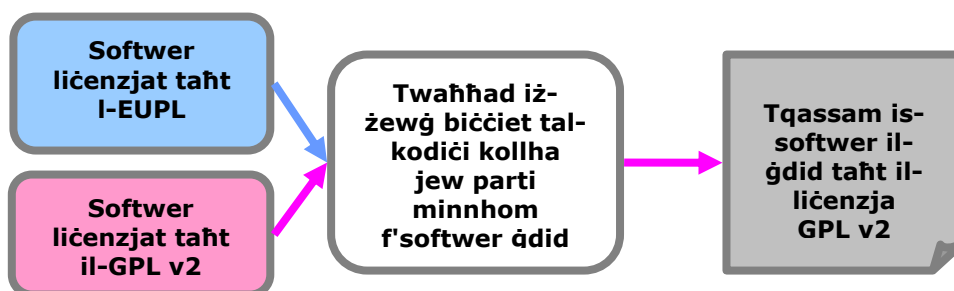
Grafika 2: Il-Klawżola ta' kompatabbiltà

Jekk joghġbok kun af, li meta tkun qed tohloq is-soluzzjonijiet tas-software minn diversi komponenti ta' Sors Miftuħ, rari tkun obligat twahħad jew tillinkja l-kodiċi tagħhom f'sors wiehed. B'mod ġenerali, il-komponenti diversi tas-soluzzjoni jinbidlu u jipproċessaw parametri mingħajr ma jitwahħdu. F'dan il-każ, kull komponent tas-soluzzjoni jista' jibqa' liċenzjat taht il-liċenzja oriġinali.