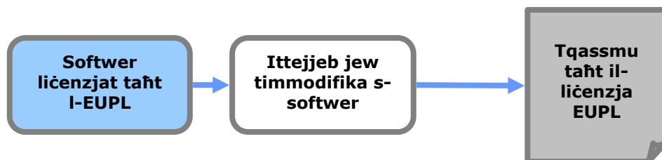
Grafika 1: L-Effett "copyleft"

L-EUPL tipprevedi eċċezzjoni importanti għar-regola ta' hawn fuq: huwa l-każ fejn l-użu tal-liċenzja kompatibbli "copyleft" huwa obbligatorju.