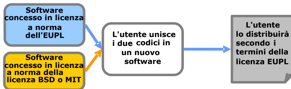
Figura 3: fusione con codice sorgente permissivo

Se l'utente decide di ridistribuire l'opera derivata, la ridistribuirà secondo quanto disposto dall'EUPL. Si tratta di un obbligo che deriva dall'articolo 5 dell'EUPL (clausola "copyleft").