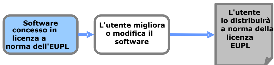
Figura 1: effetto "copyleft"

Se è stata creata un'opera derivata (ovvero è stato modificato il software, sono state aggiunte funzionalità, è stata tradotta l'interfaccia in un'altra lingua, ecc.) e se questa nuova opera viene distribuita, è necessario altresì applicare la stessa licenza EUPL (senza modificare i termini della licenza) all'intera opera derivata.